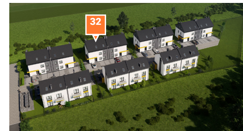
Widok osiedla z lotu ptaka